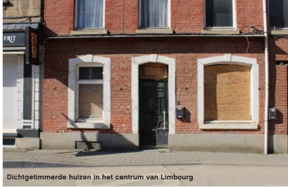
Dichtgetimmerde huizen in het centrum van Limbourg

Omdat klimaatrampen voor verzekeringsmaatschappijen een snel toenemende kostenpost vormen, probeert de branche overheden ervan te overtuigen meer actie te ondernemen om klimaatverandering een halt toe te roepen. “We streven naar voortdurende samenwerking tussen