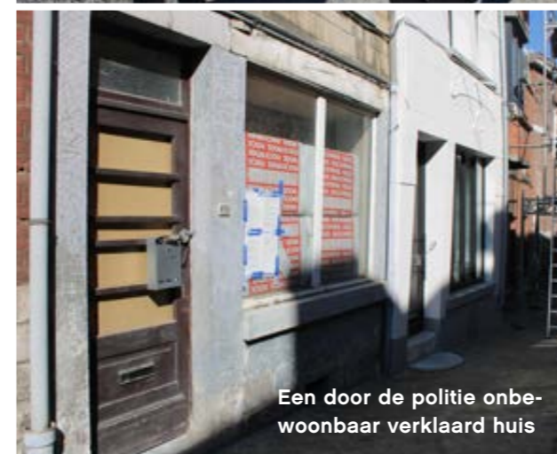
Een door de politie onbewoonbaar verklaard huis

verzekeraars, regeringen en gemeenschappen om verzekeringen betaalbaar te houden”, schrijft een Allianz-woordvoerder. “Om dat te doen moeten we de steeds hogere schadeclaims afzetten tegen risicovermindering, adaptatie en productiviteitswinst. Dat vereist een gezamenlijke krachtsinspanning.” Om die reden wil Allianz ook zelf verduurzamen. In 2030 moet de CO 2 -voetafdruk van de eigen investeringsportefeuille met 50 procent verminderen ten opzichte van 2019. Een analyse van het recentste jaarverslag leert echter dat het concern nog een lange weg te gaan heeft: eind 2024 bezat Allianz een duurzaam portfolio ter waarde van 43,5 miljard op een totaal aantal investeringen van 753 miljard. Allianz is, na de Franse Axa Groep, de grootste verzekeraar van de EU. Juist daarom wringt het dat dit soort verzekeringsmaatschappijen miljarden blijven investeren in de fossiele industrie, zegt Ward Warmerdam van het Amsterdamse onderzoeksbureau Profundo. “Verzekeraars verwachten dat de overheid met wetten en regelgeving komt om klimaatverandering tegen te gaan, maar die regels moeten vooral niet voor henzelf gelden. Zolang verzekeraars met fossiel nog het meeste geld kunnen verdienen, blijven ze daar gewoon in investeren.”