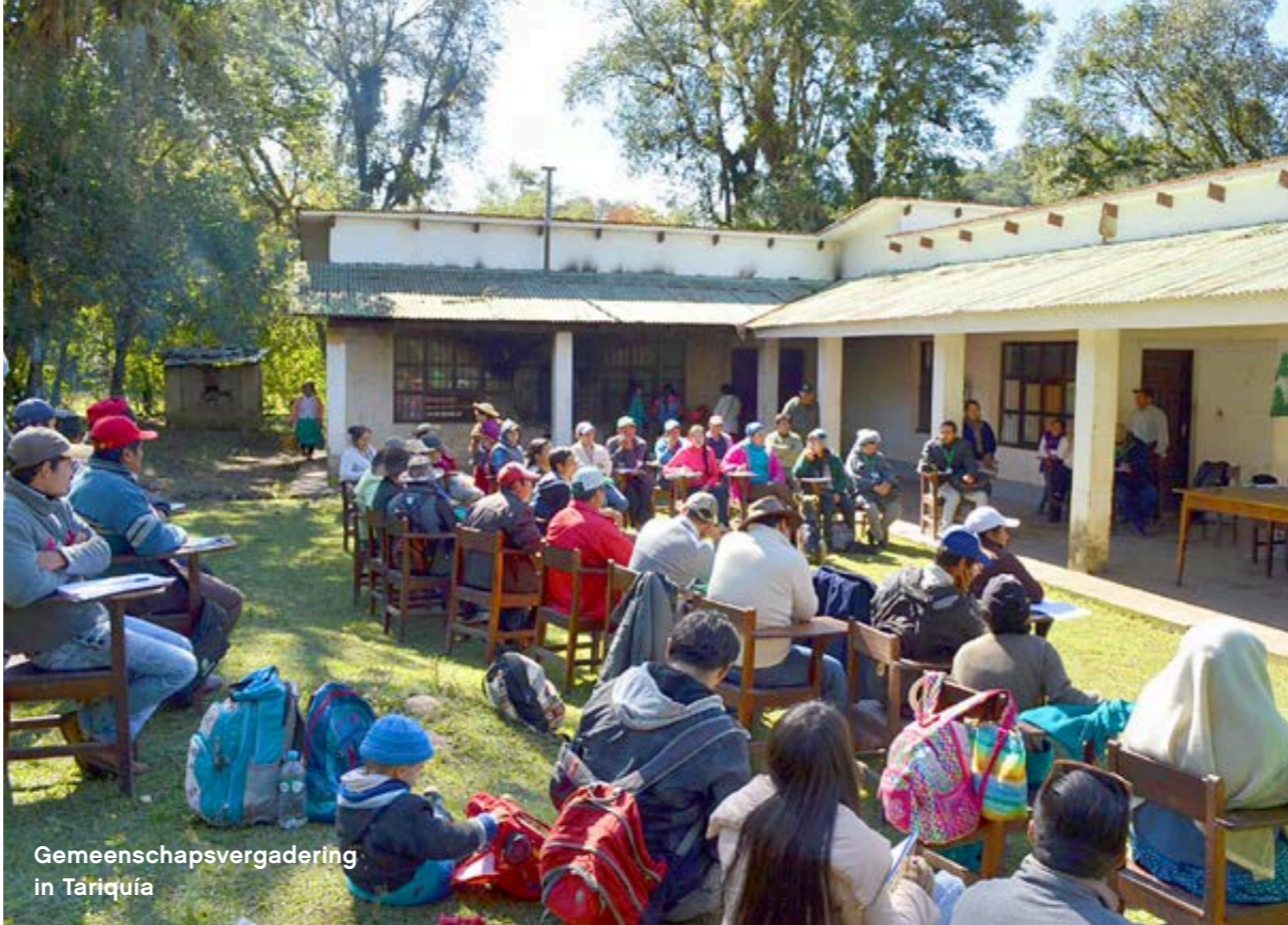
Gemeenschapsvergadering in Tariquía