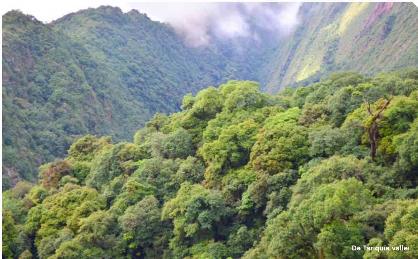
De Tariquía vallei