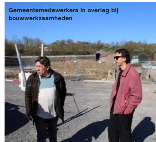
Gemeentemedewerkers in overleg bij bouwwerkzaamheden