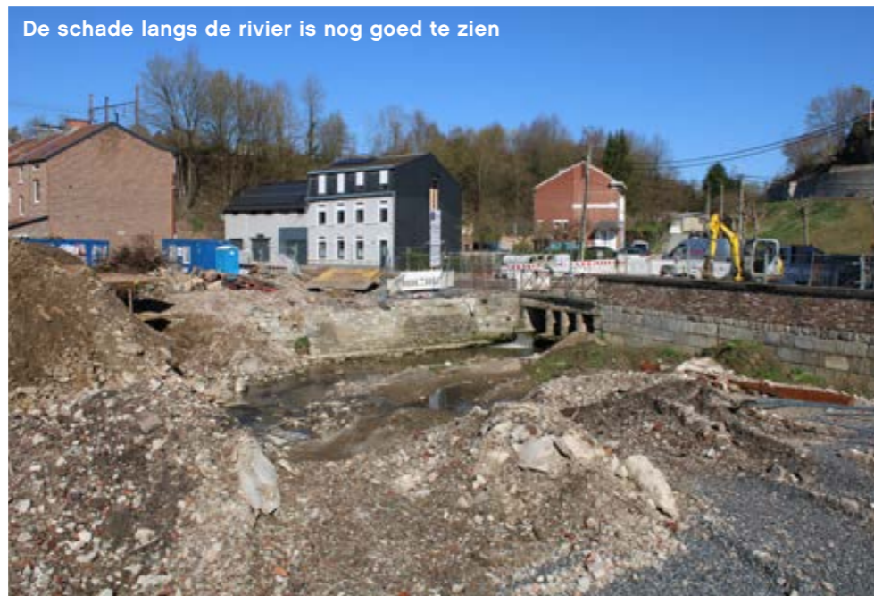
De schade langs de rivier is nog goed te zien