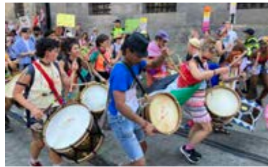
Amsterdamse percussiegroep Baque Flamingo

“Muziek is een goede manier om mensen met elkaar te verbinden en een groep te vormen”, vervolgt Van de Sande. “Het is een belangrijke middel van identificatie. Dat is niet alleen zo bij protesten. Mensen identificeren zich in het algemeen vaak via muziek met een sociale groep of beweging waar ze bij willen horen. Neem punk en hiphop. Fans voelen zich niet alleen aangetrokken tot die muziekstijl, ze meten zich er een identiteit mee aan die je ook weer ziet terugkomen in hun kledingstijl. Op die manier werkt muziek als bindmiddel: je laat ermee zien