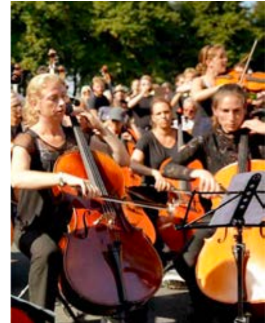
XR Musicians: het A12-orkest van Extinction Rebellion

Muziek is heel geschikt om niet alleen mensen maar ook protestenbewegingen met elkaar te verbinden, ziet ook Van de Sande. “Door je muziekkeuze kun je verbanden leggen en laten zien dat het allemaal onderdeel is van een bredere sociale beweging. Denk bijvoorbeeld aan het Italiaanse nummer Bella Ciao , dat een antifascistische geschiedenis heeft. Dat wordt nu ook veel gezongen in de klimaatbeweging.”