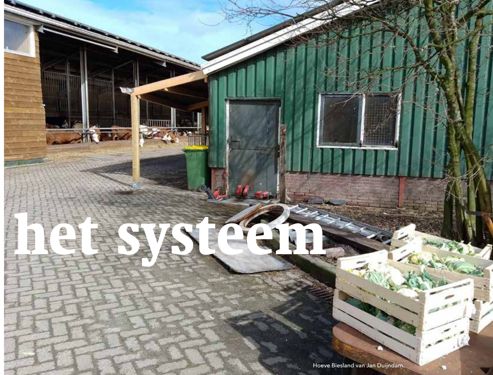
Hoeve Biesland van Jan Duijndam.

Duijndam zelf maakte in 1997 al de keuze om over te stappen op biologische productie. Zijn boerderij, Hoeve Biesland, stamt uit 1910 en ligt in de polder ten oosten van Delft. In totaal beschikt hij over 300 hectare land en telt zijn bedrijf 400 melkkoeien. Relatief groot voor een Nederlandse boerderij, lacht hij. Gehuld in een groene