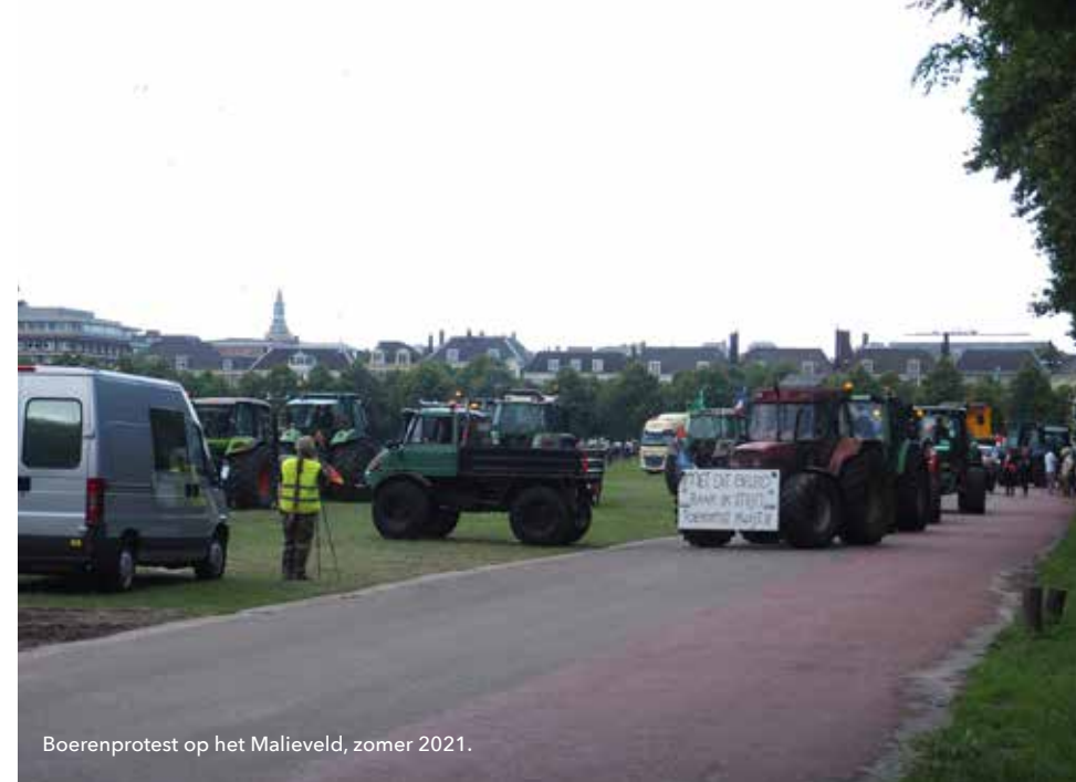
Boerenprotest op het Malieveld, zomer 2021.

Meer dan vijftig partijen onderhandelen sinds januari over de toekomst van de agrarische sector in Nederland. Prangende vragen als hoeveel grond beschikbaar blijft voor boeren en tuinders, financiering en een nieuw verdienmodel voor boerderijproducten komen daarbij aan bod. Waar de Nederlandse Melkveehouders Vakbond begin februari een bom leek te willen leggen onder de onderhandelingen, stapten in maart zowel de Dutch Dairy Board en belangenclub Agractie uit het overleg. LNV wil dat uiterlijk in mei een landbouwakkoord op tafel ligt.